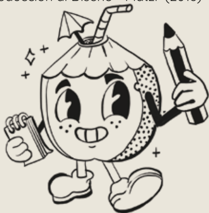
Ilustración & pintura