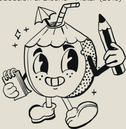
Ilustración & pintura

Curso de Diseño Visual de Marcas - Platzi (2022) What Design Can Do - Conferencia en México de activismo en el diseño (2018) Revoltorio. Laboratorio de Creación (12 Horas) (2017) Curso Práctico de Composición Visual - Platzi (2023) Curso de Introducción al Diseño - Platzi (2018)